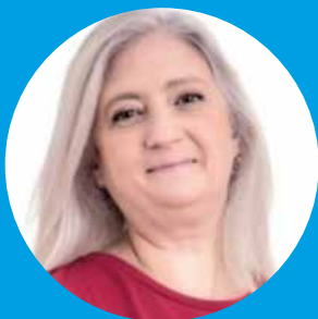
Jurista e Empreendedora Social

Trabalhou durante cerca de 31 anos em estruturas públicas e de economia social, nos domínios da Intervenção Social, Envelhecimento, Reinserção Social, Responsabilidade Social e Voluntariado. Foi Diretora da Fundação Montepio, Administradora Não Executiva das Residências Montepio, Vice-Presidente do IRS, Presidente do GRACE Empresas Responsáveis, membro do Conselho Geral do ISCTE e integrou diversas comissões nacionais na área do mercado social de emprego e saúde mental. Docente em pós-graduações e mestrados em diversos estabelecimentos de ensino superior, autora de diversos artigos e livros e membro dos órgãos sociais de diversas entidades de economia social. É Vice-Presidente da Aliança ODS Portugal e fundadora da Casa Família Oliveira Guimarães.